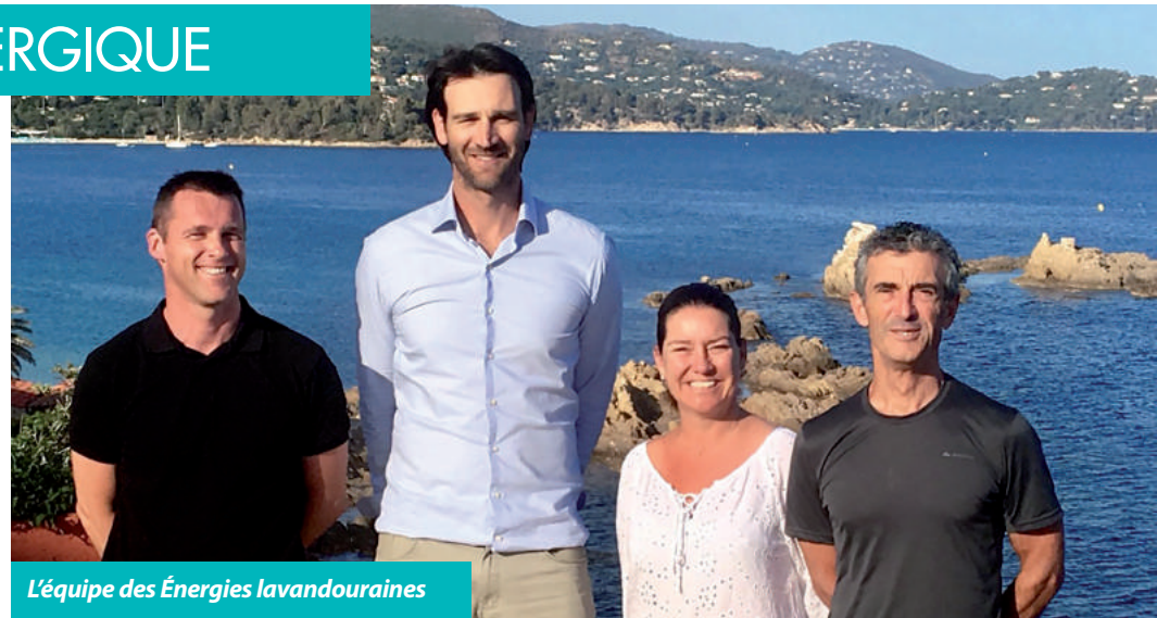
L'équipe des Energies lavandouraines