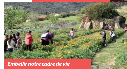
Embellir notre cadre de vie