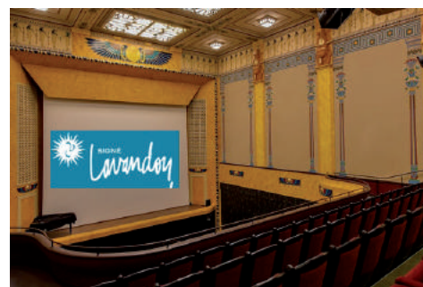
Oui au cinéma, mais pas financé par les contribuables

Nous sommes favorables au projet de cinéma pour l'animation du Lavandou toute l'année. Mais le maire, dans des conditions obscures, a torpillé son propre projet initial confié à un opérateur avec lequel il est en procès. Et il a bricolé en urgence un autre projet à financer entièrement par la commune pour plus de 4 millions d'euros ! Et sans aucune recette pour la collectivité ! Nous redéfinissons ce projet d'une façon plus réaliste et chercherons un opérateur pour