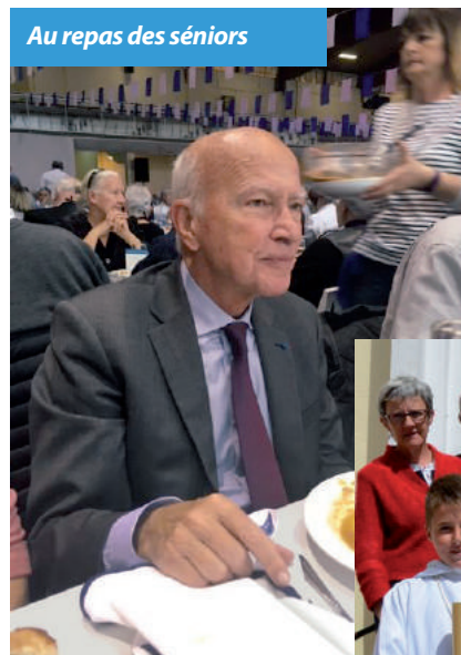
Au repas des seniors

Vous êtes entrepreneur, artisan, commerçant, propriétaire d'une résidence secondaire, venez participer à la vie démocratique du Lavandou. C'est votre droit et même un devoir civique. VOUS POUVEZ Y VOTER. Alors aidez-nous à améliorer notre commune.