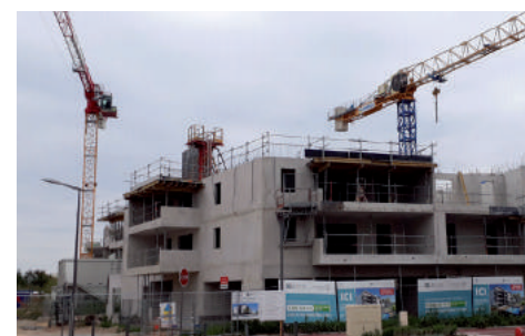
Stop au bétonnage !

Le prétendu Eco Quartier est un double échec. Urbanistique car il n'est pas dans l'esprit du village. Démographique car il devait rajeunir la population du Lavandou. Or, une classe de plus a été fermée. Nous créerons de petits programmes de 2 ou 3 logements sociaux (qui peuvent être du rachat ou de la réorientation du bâti existant) répartis surtout sur le territoire communal, réservés aux habitants et notamment aux jeunes couples. Une ville où on meurt plus qu'on ne naît voit son avenir bouché.