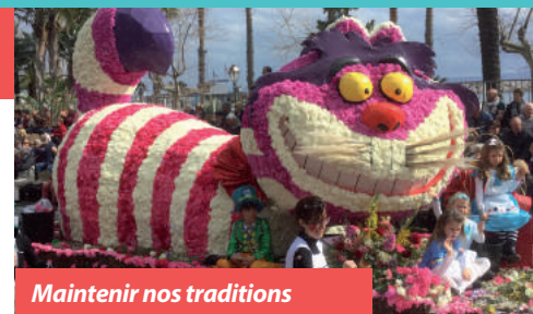
Maintenir nos traditions