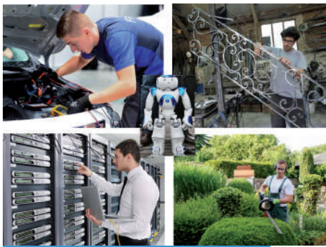
Développer l'économie et l'emploi